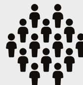
Grupos de Padres