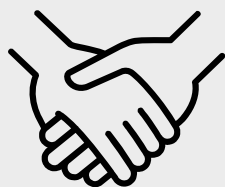
Doulas de Parto y Posparto