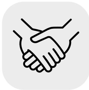
Birth & Postpartum Doulas