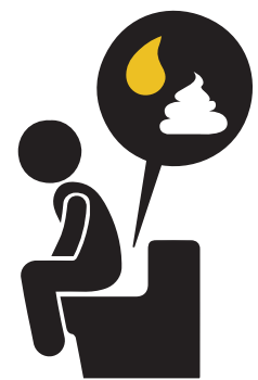
ORINA OSCURA, HECES BLANCAS, Y DIARRHEA