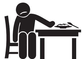
PÉRDIDA DE APETITO