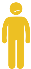
ICTERICIA (COLORACIÓN AMARILLENTA DE PIEL U OJOS)